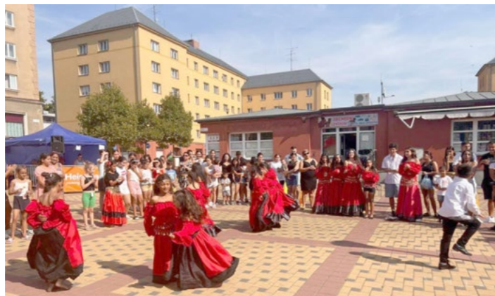
TRADIČNÍ AKCE. Zájezdy, ŠumbarkFEST, Mikuláš - to jsou oblíbené a již tradiční komunitní akce, které zpřijemňují život na Šumbarku.

Každoročně probíhají na náměstí T.G. Masaryka akce pro rodiny. Letos v září jsme uspořádali tradiční ŠumbarkFEST. Kulturní program pomohly vytvořit vystupující děti z NZDM Bumerang Armády spásy a také děti ze Spolku Velká náruč z Horní-Suché. Taneční vystoupení dětí oživilo celé náměstí. Program rovněž obohatilo pěvecké vystoupení AC Šumbark a sólový zpěv v po-