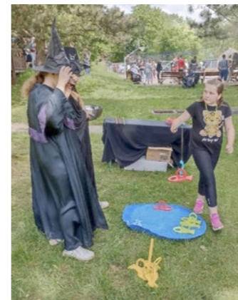
PROPOJENÍ. V zahradě dochází k přirozenému propojení na mnoha úrovních – děti různých věkových kategorií, dospělých a přírody. SŠ a ZŠ HAVÍŘOV-ŠUMBARK

Jedná se o krásné místo plné života a barev, které pozitivně ovlivňuje žáky, učitele i celou školní komunitu a je cenným nástrojem pro vzdělávání a všestranný rozvoj žáků. Celé klima zahrady ovlivňuje vývoj žáka, vyučuje ho samo o sobě. Rozmanitost přírodního prostředí podněcuje novými do-