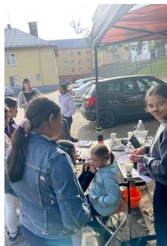
NEVŠEDNÍ HALLOWEEN. Pro děti byl kromě tradičních halloweenských atrakcí připraven také fotbalový zápas.